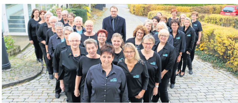
Frauenchor Cantiamo aus Garbeck feiert sein 55-jähriges Bestehen. Geplant ist ein Kaffeekonzert im September.

Es soll nicht dabei bleiben. „Sobald es möglich ist, werden wir wieder unsere beliebten Reibekuchen